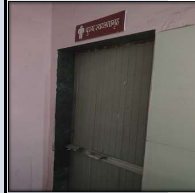
पुरुष व महिलांकरीता स्वच्छता गृहाची व्यवस्था